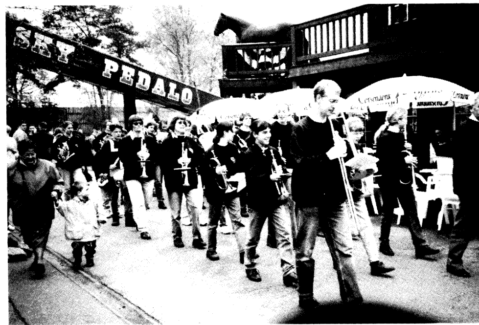
Het jeugdorkest in Bobbejaanland 1995.