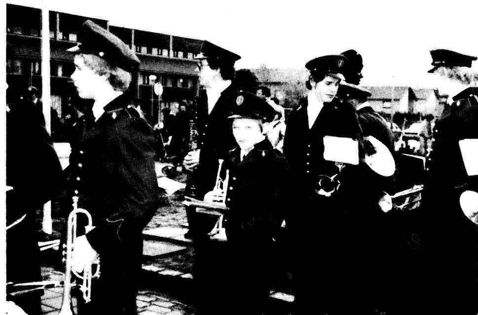
Opening van de Brink ±1980

slagwerk en hierin zien we de huidige fanfare-bezetting terug. Ergo harmonieën komen voort uit de infanterie- en fanfares uit de cavalerie-korpsen. In Engeland is ongeveer tegelijkertijd een geheel eigen vorm van het blaasorkest ontstaan uit de toen opkomende fabrieksorkesten de "brassband". Deze fabrieksorkesten ontstonden uit het besef van werkgevers dat ze ook sociale verplichtingen hadden en ze stelden fondsen beschikbaar om deze brassbands van de grond te krijgen. De bezetting is in de loop van de tijd geëvolueerd en bestaat thans uit cornetten, saxhoorns, trombones en slagwerk.