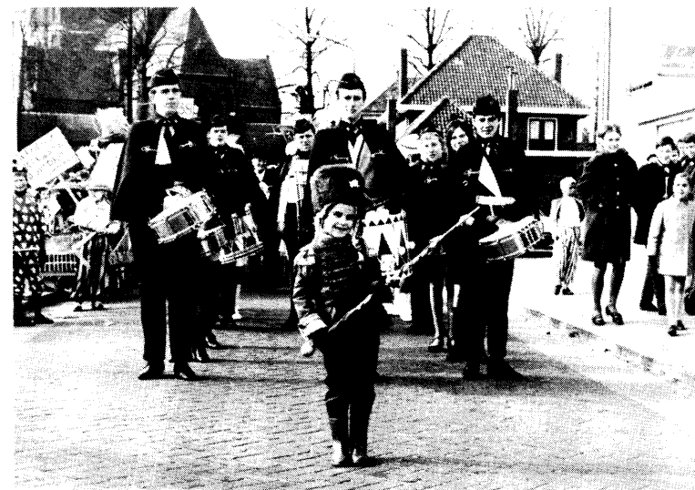
Karnavalsoptocht in Leende ±1970.

De drumband heeft gedurende de jaren 12 keer deelgenomen aan een federatief concours van de F.K.M. Daarbij werd acht keer een eerste prijs behaald en viermaal een tweede.