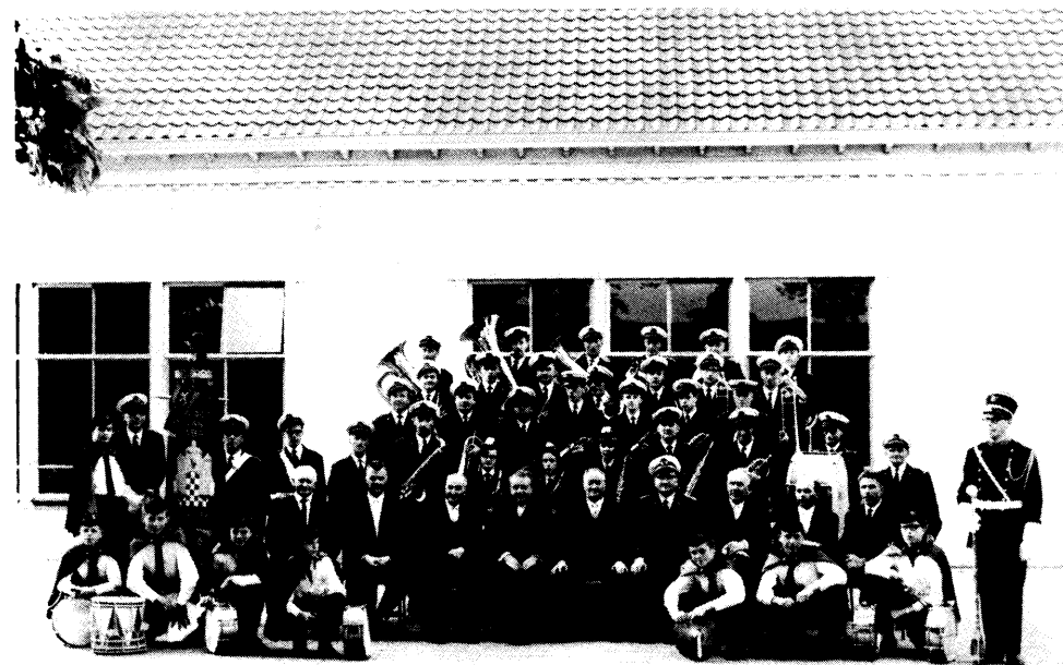
De eerste uniformen

Het lijkt er dus op dat 14 jaar de levensduur van een uniform is als dat zo is, zijn we over 5 jaar weer aan vervanging toe.