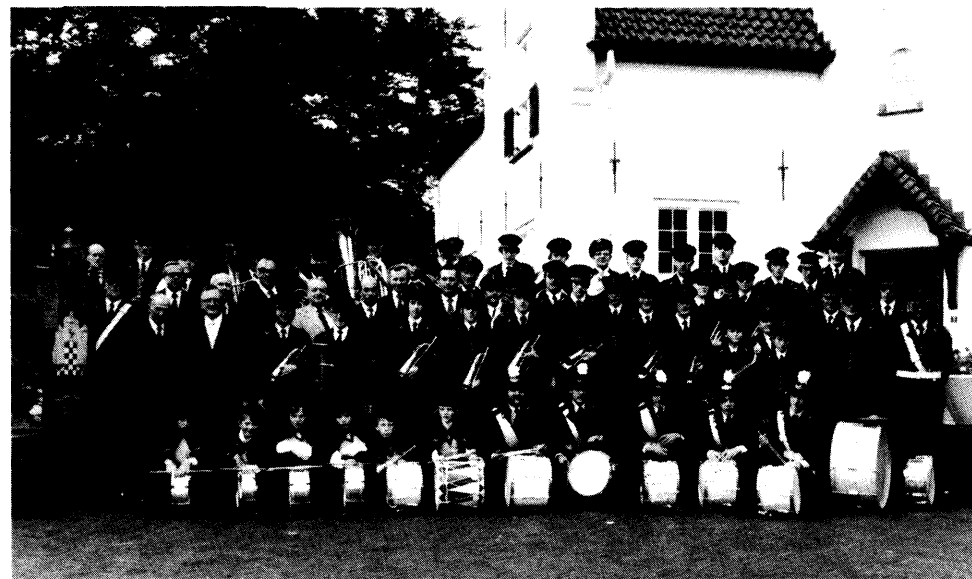
Nieuwe uniformen 1975.

We hopen dat viering van ons jubileum de Maarheezer gemeenschap zo zal aanspreken dat we volgend jaar samen kunnen zeggen: "DAT WAS EEN MOOI FANFAREJAAR!".