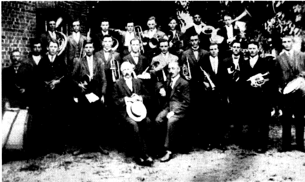
Fanfare Sinte Caecilia (1925 - 1935)