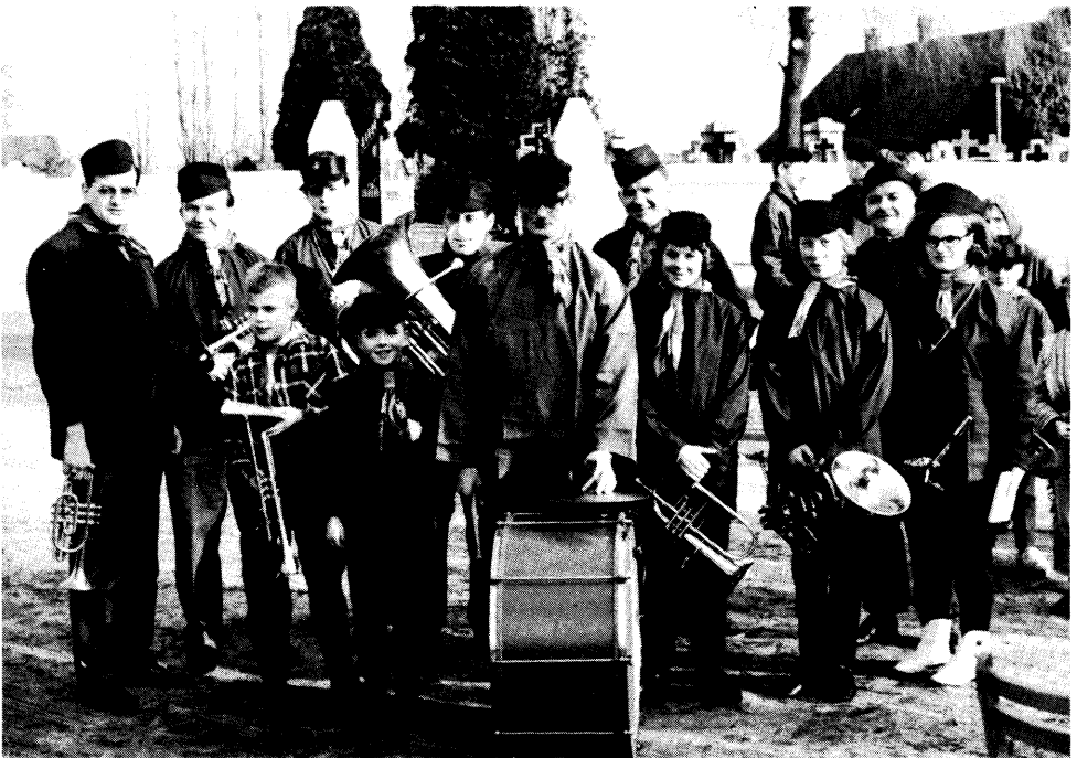
De hofkapel ±1968.

Drukkerij Sweegers Smits van Oyenlaan 9a, 6026 CN Maarheeze.