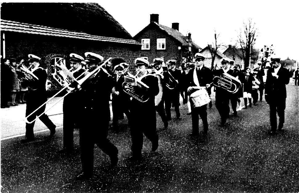
Karnavalsoptocht in Maarheeze ±1968.

Uit de geschiedschrijving van de fanfare blijkt, naast vele "ups en downs", ook een zwarte periode te zijn geweest met betrekking tot de vrouwelijke inbreng. Enige decennia geleden was het vaak zo dat meisjes in een verzorgend beroep terecht kwamen en dan nogal eens intern werden gehuisvest. Dit maakte dat jonge vrouwelijke muzikanten vaak afhaakten als ze net een beetje op niveau konden meedoen. Toen op een gegeven moment weer alle vrouwelijke leden om de een of andere reden bedankten was de maat vol en besloot het toenmalige bestuur geen meisjes meer aan te nemen voor de muziekopleiding. Het fanfarekorps heeft dus een flink aantal jaren alleen maar uit mannelijke muzikanten bestaan. Deze vorm van discriminatie begon echter steeds meer slijtage te vertonen aangezien ook nogal wat jonge mannen op kamers gingen om te studeren. Op een gegeven moment is het toenmalige bestuur maar overstag gegaan en zijn er weer meisjes toegelaten op de opleidingen. En dat is maar goed ook anders moest de fanfare het nu met ongeveer 20 muzikanten minder doen.